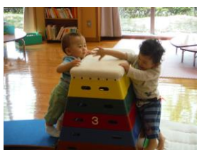
ぼくらだってまけないぞ！