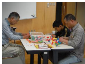
男同士のコミュニケーション 新しいブロック“アイクリップ”に挑戦！