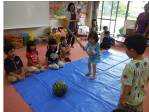
「わたしもがんばる！」 どンドンひびが・・・