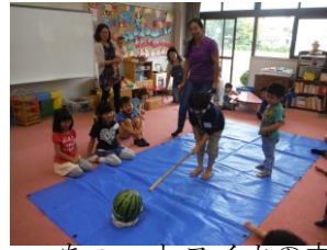
ちょっとスイカの方を変えて 学年が上がったので難易度アップ