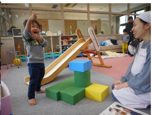
JくんはHくんのお兄ちゃんになりました。今日は、お姉さんとも面白いもの作っていたね。自分のイメージで遊びこむ姿に、初めて参加した栄養士志望のお姉さんも元気もらいます。