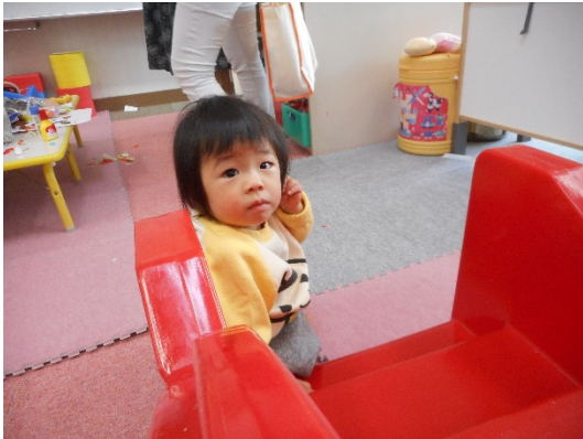
さて、そろそろ遊ぼうかな まだ眠そう・・・Nちゃん