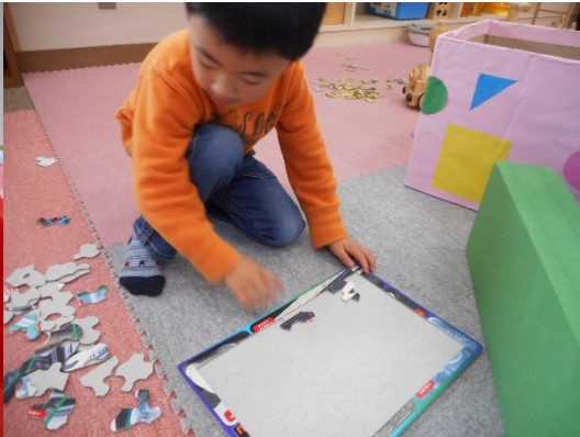
Tくん、今日は、5回以上はめた新幹線！ ママとだけでなく、先生やお姉さんともやったよ