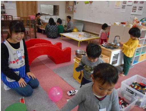
真剣に作り始めたHくんです