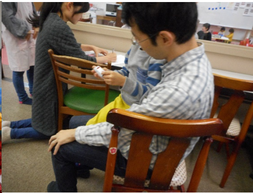
道路がどんどんつながります。Mくんはパパと一緒にうれしそうです。