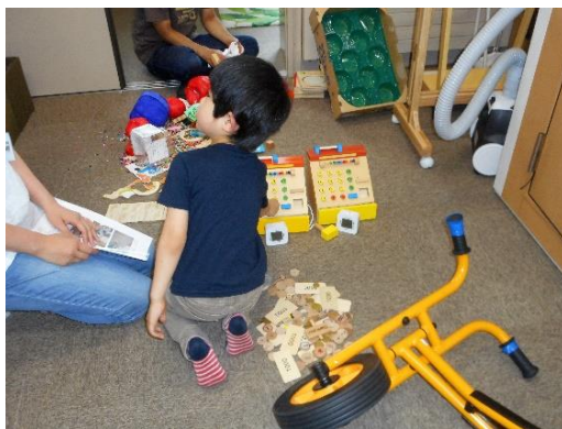
こちらは、レジを3つ並べたりして・・・