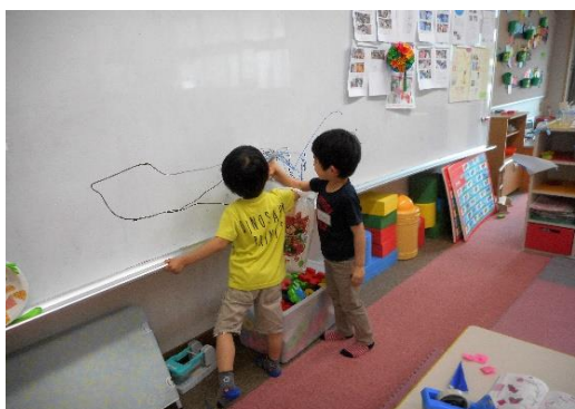
「ポー土争い」になりましたが、みんな笑って食べていますね・・・