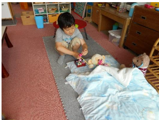
「リアルお医者さんごっこ」あり