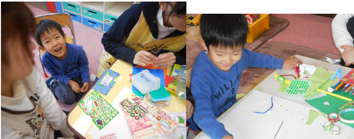
3 人もいい表情です。その 3 人に寄り添う学生たちも、本当によい時を過ごしていると思いました。