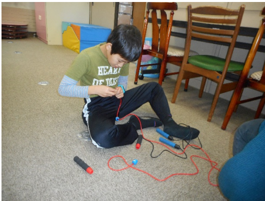
なわとびの2重跳びが51回できました！