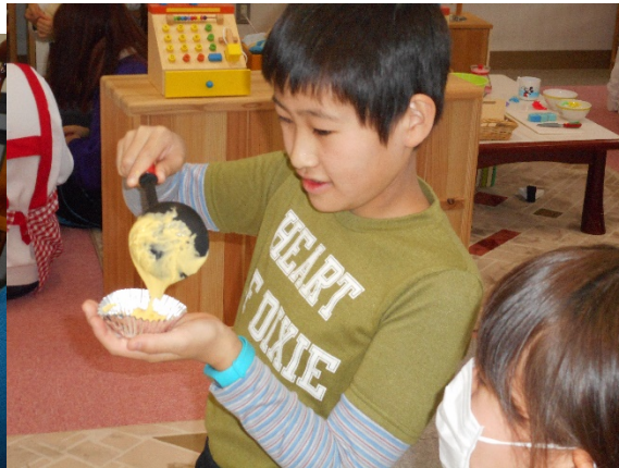
おやつ作りも真剣なRくん