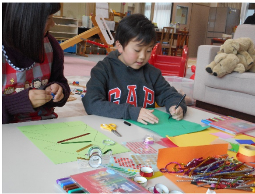
クリスマスツリーを描き始めたＹくん