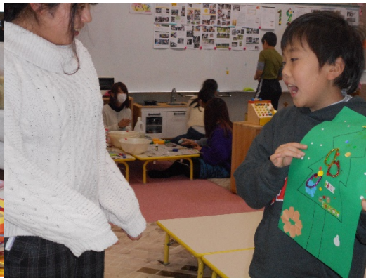
出来上がってお姉さんに見せに行きました