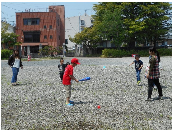
みんなイメージするルールが違っていたりして、すっちゃかめっちゃかでした。