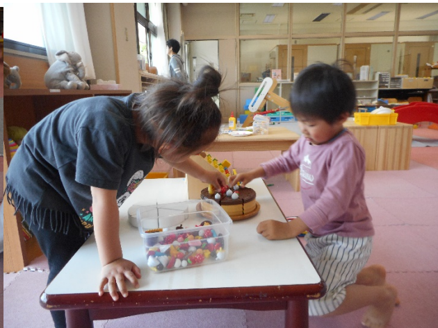
Jくん、Hくん、Sちゃんの3人は、きょうだいの様子です。