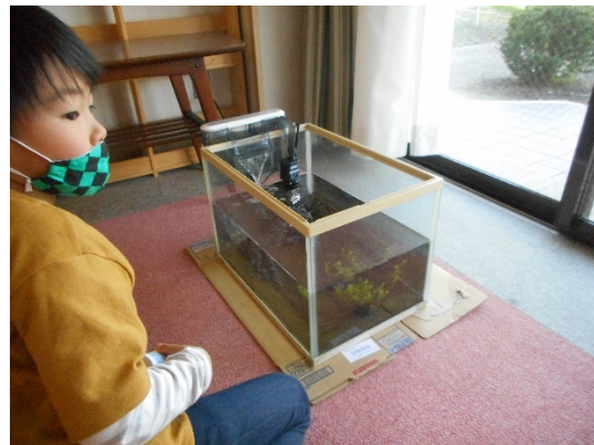
メダカに興味津々Jくん