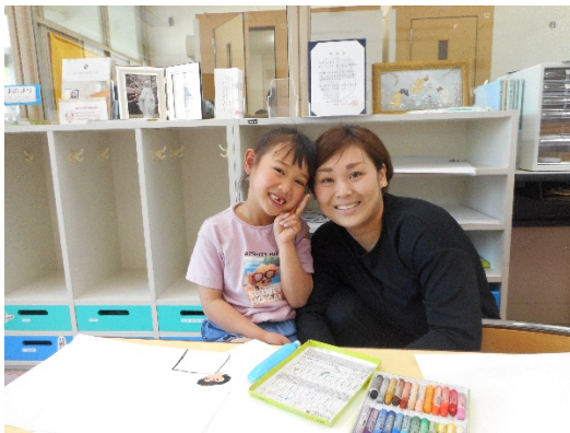
Sちゃんは、前歯が抜けたことを真っ先に 教えてくれました。