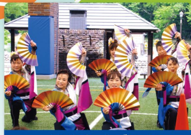
ファンキーレディース