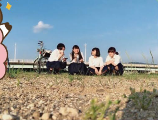
福島西高校バンド クレハル