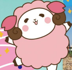
桜の聖母短期大学 公式キャラクター 「どりーぶ」