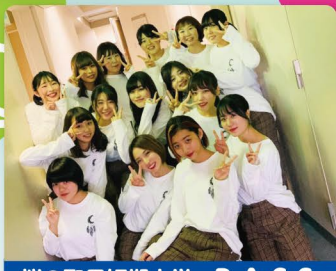
桜の聖母短期大学 P.A.S.S.